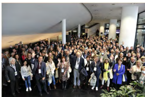
Les participants aux Assises Nationales Avril 2022 - Meaux

Le 31 mars et le 1 er avril 2022 ont eu lieu les Assises nationales du label à Meaux. Près de 400 élus, techniciens, membres du réseau de toutes les régions de France étaient réunis.